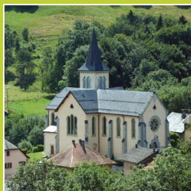
Village de la Muraz