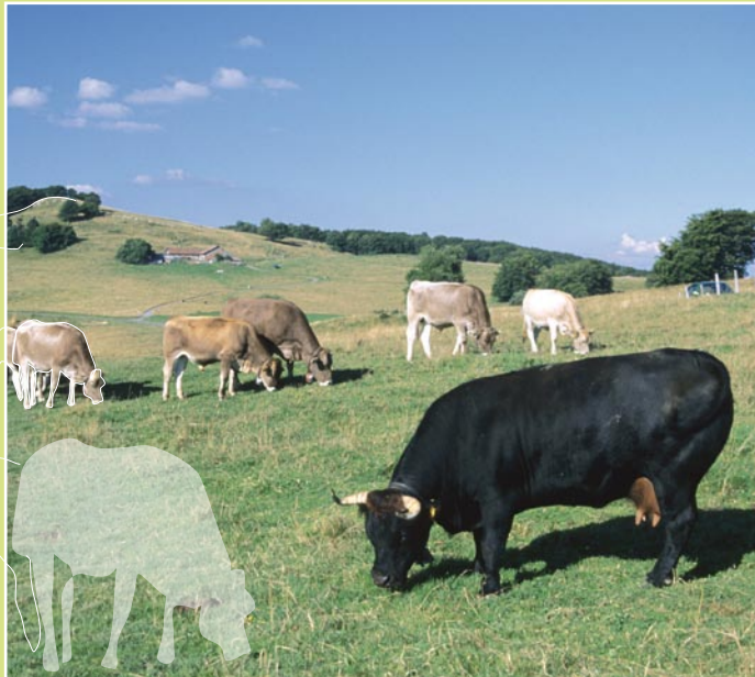
Bétail pâturant les alpages sommitaux