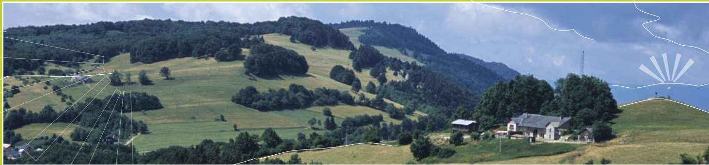
Plateau sommital et chalet des Crêts

Je referme bien les portails de clôture, j'empêche mon chien de divaguer et je respecte les rares points d'eau. Si les alpagistes étaient trop souvent dérangés et cessaient de faire pâturer le Salève, ceci signerait la disparition du « Salève belvédère » par l'enrichissement puis le reboisement naturel. Par contre, si j'achète des produits des fermes locales : fromages, charcuterie, légumes et fruits, je soutiens ainsi l'agriculture qui entretient le paysage.