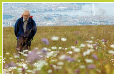
Randonneur sur les sommets du Salève

Multiplication anarchique des aménagements : la fréquentation importante du massif peut conduire à une multiplication des « verrues paysagères » sans une politique d'aménagement d'ensemble.