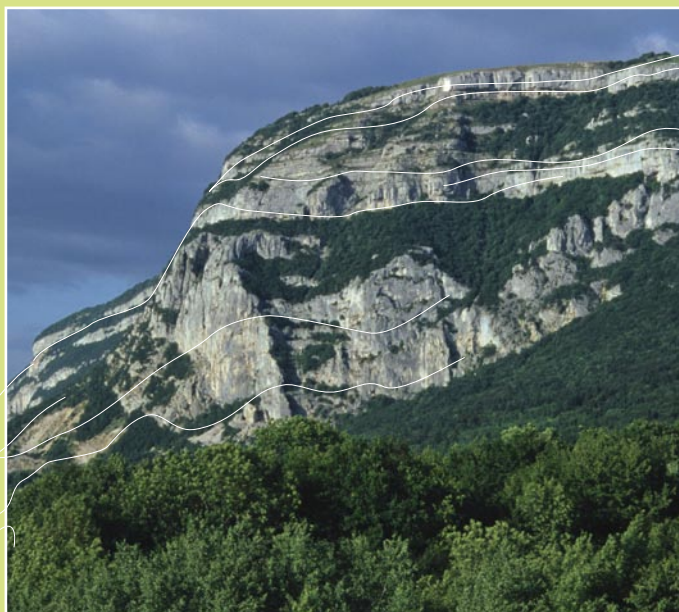
Falaises du versant nord ouest

La directive fixe des orientations, des principes de protection qui s'imposent désormais aux documents d'urbanismes (P.L.U., S.C.O.T). Une carte localise les espaces, les points de vue ou les éléments du paysage à prendre en compte.